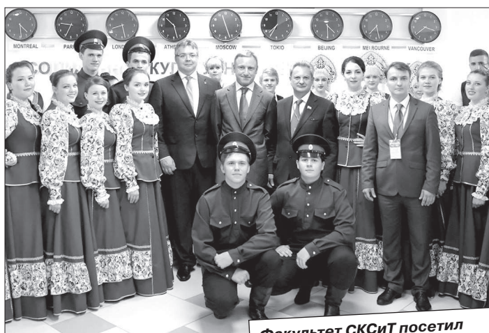
Факультет СКСиТ посетил министр образования и науки РФ Дмитрий Ливанов.