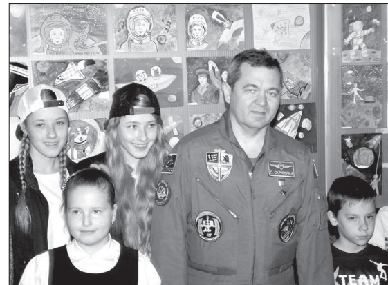
• Победители конкурса детского рисунка «Я рисую космос» получили призы из рук космонавта.