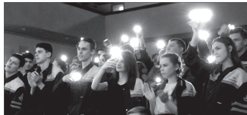
• Встреча в Ставропольском государственном аграрном университете.