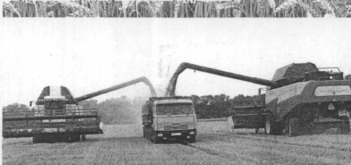
Вся задействованная в уборке техника – это современные высокопроизводительные комбайны, лучшее, что сегодня может предложить сельхозмашиностроение.

как организовать работу максимально эффективно