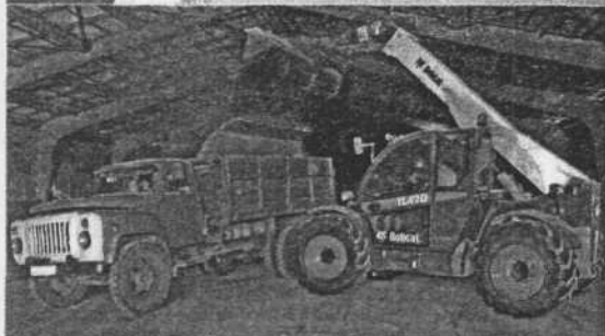
Мало собрать урожай, важно его сохранить.

провести уборку в максимально сжатые сроки. Настрой у коллектива боевой.