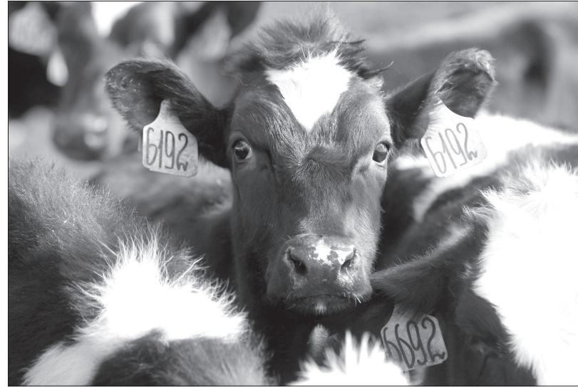
• Согласно прогнозам, благодаря мерам господдержки к 2021 году численность коров в СХП края превысит 28 тысяч голов.

Еще один из путей оживления отрасли - поддержка малого сектора АПК, убеждены в региональном аграрном ведомстве. На Ставрополье успешно реализуются программы по поддержке начинающих фермеров и созданию семейных животноводческих ферм. Вот один из наглядных примеров. Фермер Иван Хромых из Новоселицкого района еще в 2015 году по программе «Поддержка начинающих фермеров в Ставропольском крае на 2015 - 2017 годы» выиграл грант почти на полтора миллиона рублей. Благодаря ему был построен комплекс для молочного поголовья, приобретены доильное оборудование и тракторы. Часть денег ушла на закупку двенадцати племенных животных в СПК колхозе-племзаводе