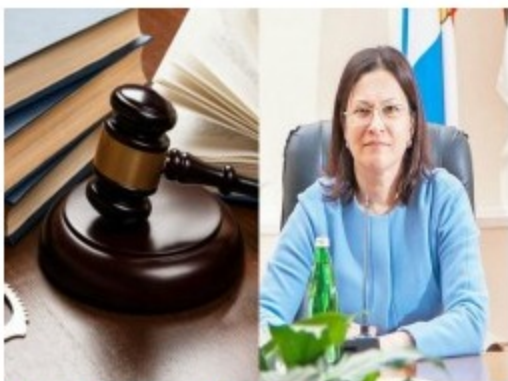
Судебное разбирательство в отношении экс-главы Ессентуков окончено