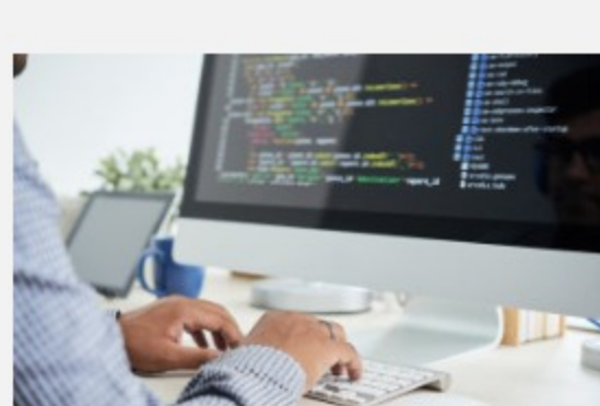
Названы самые востребованные IT-профессии в России "на удаленке"

Тем не менее выбирать компетенции нужно с умом, ведь сейчас потребность в тех или иных профессионалах меняется очень быстро.