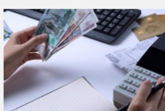
Названы профессии, где рост зарплат серьезно обогнал инфляцию

Инициатива принадлежит минпросвещения России и Союзу "Молодые профессионалы (WorldSkills Russia)". В крае участникам программы на выбор предоставят 31 специальность, причем они очень разноплановые, так что желающий освоить новую профессию сможет подыскать именно то, что ему больше подходит. Есть возможность выучиться на повара, сварщика, инженерного дизайнера CAD или ветеринара. А тот, кто захочет стать предпринимателем, узнает, как начать свое дело.