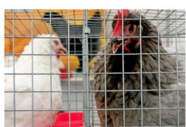
Китай на год вперед выкупил в Крыму куриные лапы и головы

Из-за массового применения антибиотиков, причем как в животноводстве, так и при лечении людей, у бактерий постепенно формируется невосприимчивость к ним, и препарат просто перестает действовать. Это одна из важнейших проблем современной медицины, с которой никак не ожидали столкнуться во времена Александра Флеминга, выделившего пенициллин - первый антибиотик на планете. Без использования этих препаратов любая инфекция становится значительно опаснее и может привести к летальному исходу.