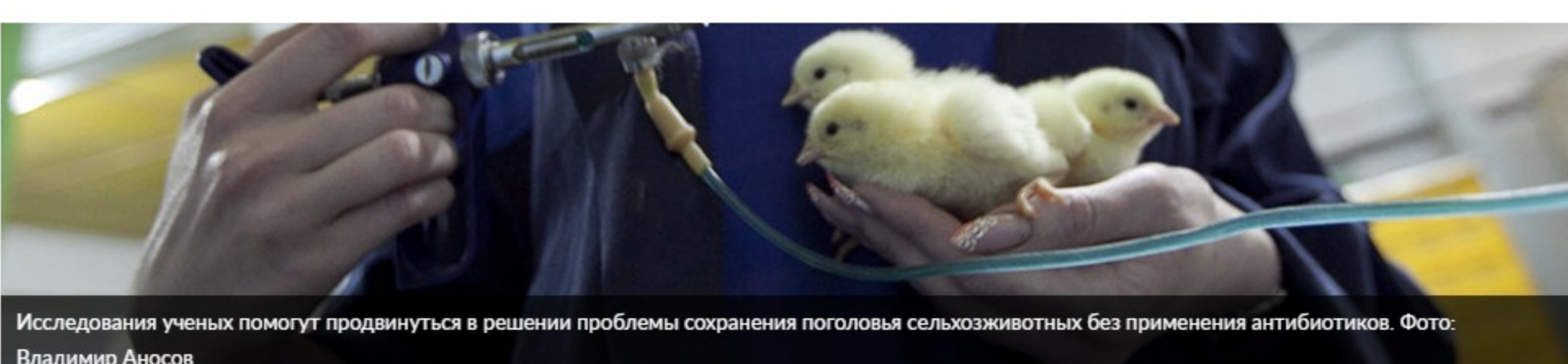
Исследования ученых помогут продвинуться в решении проблемы сохранения поголовья сельскохозяйственных животных без применения антибиотиков.

Конструкторы России Наука ПРО Высшая школа Просто космос Дигитика Медицина Мой Гагарин