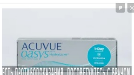
Линзы ACUVUE with HydraLuxe