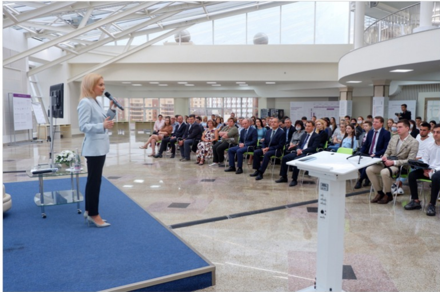
Ольга Тимофеева

В законе будет четко прописано, что прививка от коронавируса добровольная, пообещала вице-спикер Госдумы Ольга Тимофеева в ходе встречи со студентами и преподавателями Ставропольского государственного аграрного университета.