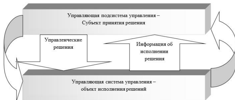
Схема процесса управления

В данном разделе РПД приведены типовые задания для проведения текущего контроля успеваемости студентов. Полный перечень заданий содержится в учебно-методическом комплексе по дисциплине «Информационные технологии», который размещен в электронной информационно-образовательной среде Университета и доступен для обучающегося через его личный кабинет на сайте Университета.