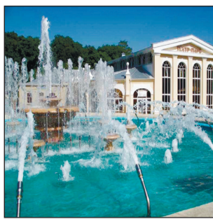
«СИСТЕМА» поглощает курорт