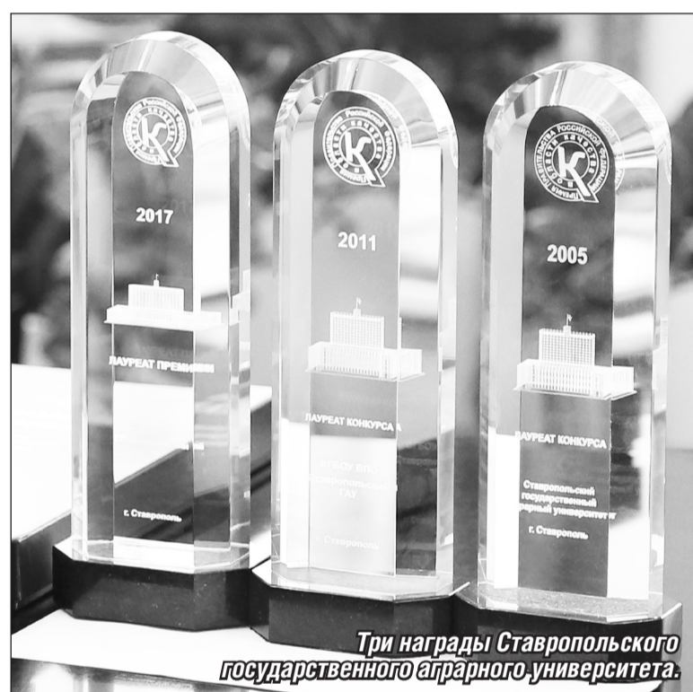
Три награды Ставропольского государственного аграрного университета.

Ежегодно в СтГАУ выделяют санаторно-курортные путёвки в профсоюзных здравницах (со скидкой 20% от стоимости)