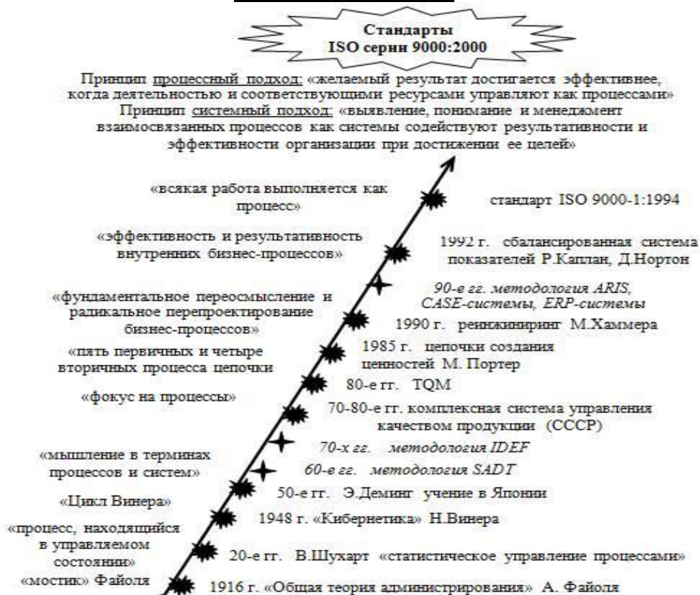
Рисунок – Этапы развития процессного подхода к управлению организацией и методологий описания процессов