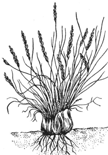
Рис. 1. Плотнокустовой тип кущения злаков

К плотнокустовым злакам относятся: луговик дернистый (щучка), белоус торчащий и др.