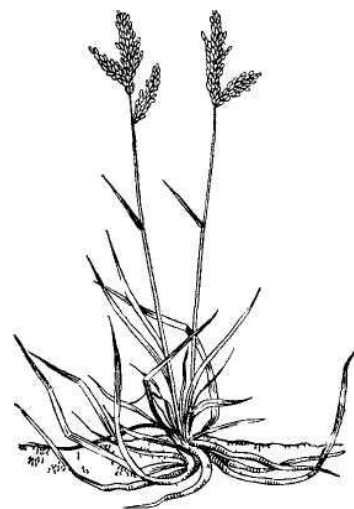
Рис. 3. Корневищно-рыхлокустовой тип кущения злаков

Корневищно-рыхлокустовые злаки имеют густую корневую систему и дают ровную, крепкую дернину, благодаря чему хорошо переносят выпас скота. Лучше всего развиваются на рыхлых структурных почвах.