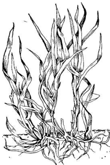
Рис. 2. Корневищный тип кущения злаков

Таким образом, в результате вегетативного размножения вокруг материнского побега образуется сеть корневищ с большим количеством побегов.