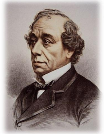
Бенджамин Дизраэли, английский государственный деятель

Наибольшего успеха добивается тот, кто располагает лучшей информацией