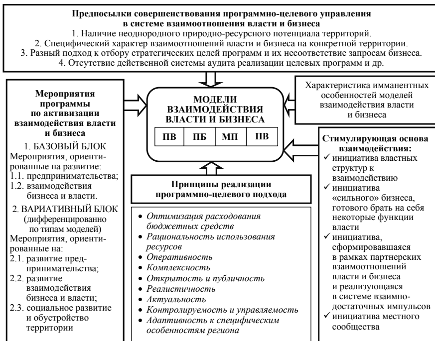
Рисунок 5 – Схема развития взаимодействия власти и бизнеса на основе программно-целевого подхода

Кроме того, в работе обоснованы принципы программно-целевого управления в исследуемой сфере, охарактеризована его стимулирующая основа и предпосылки дальнейшего совершенствования, что позволило сформировать модельное видение процесса развития системы взаимодействия власти и бизнеса с использованием программно-целевого подхода (рис. 5).