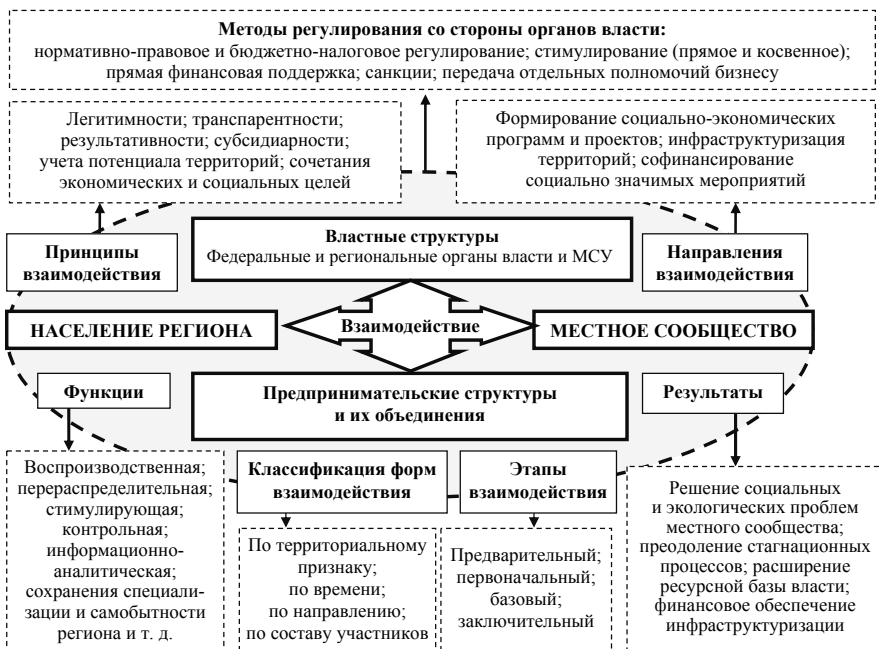
Рисунок 1 – Схема механизма взаимодействия властных и предпринимательских структур (базовые элементы)

Раскрытие сущностного содержания механизма взаимодействия властных и предпринимательских структур позволило уточнить, дополнить и структурировать его составные элементы (рис. 1).