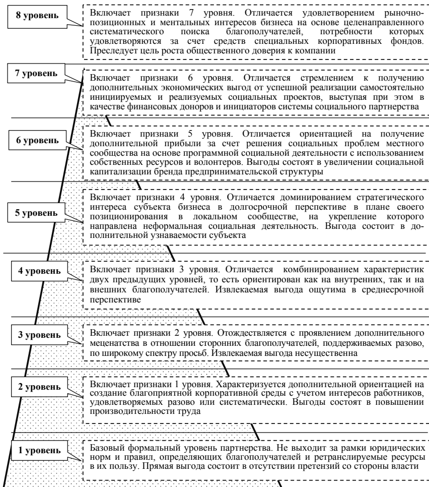
Рисунок 2 – Уровни взаимодействия института власти и бизнеса в рамках модели «партнерство»

3. Совершенствование методического обеспечения оценки взаимодействия властных и предпринимательских структур, в большинстве своем трудно формализуемой, должно предусматривать использование экспертно-скоринговых подходов, позволяющих провести сопоставление взаимно-встречной деятельности бизнеса и власти по отношению друг к другу, выявить системные дисбалансы в их взаимодействии, а также эмпирически идентифицировать доминирующую модель взаимодействия власти и бизнеса в рамках отдельной территории.