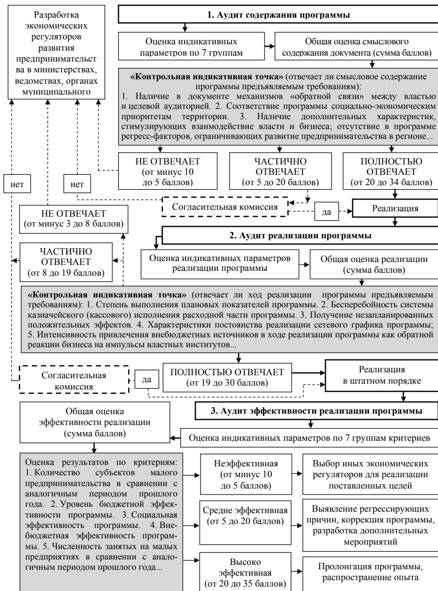
Рисунок 6 – Градуалистический порядок комплексного аудита программно-целевого управления взаимодействием властных и предпринимательских структур