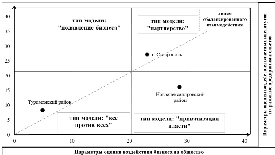
Рисунок 4 – Графическая интерпретация результатов экспертной оценки взаимодействия властных и предпринимательских структур

* 1 – Ставрополь; 2 – Новоалександровский район; 3 – Туркменский район.