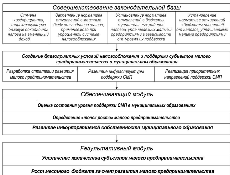
Рисунок 3 – Механизм формирования доходной части местного бюджета за счет малого предпринимательства

В работе обоснована возможность установления повышенного норматива отчислений в бюджеты муниципальных районов от налогов, уплачиваемых малыми предприятиями в зависимости от уровня их поддержки, предложен методический подход к типологизации муниципальных образований в зависимости от уровня поддержки и развития СМП. Суть данного методического подхода заключается в последовательном выполнении ряда аналитических этапов. На первом этапе, состоящем из набора традиционных для экономических исследований процедур, проводится формулировка целей и задач, отбор комплекса оценочных критериев, формирующих информационно-эмпирическую базу. Последующий, расчетный этап предполагает приведение отобранных показателей к стандартизированному виду, сопоставление эталонных и фактических значений показателей, позволяющих сегментировать муниципальные образования по уровню поддержки и развития малого предпринимательства; расчет интегрального показателя, на основании которого проводится итоговое ранжирование муниципальных образований по уровню развития и поддержки малого бизнеса (табл. 4).