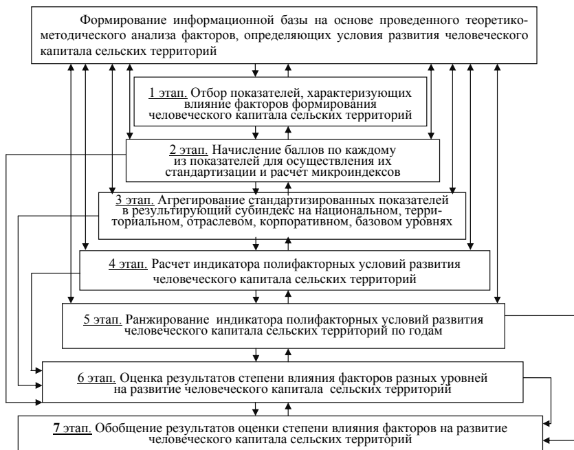
Рисунок 2 – Общая схема определения ИЧКСТ

В этой связи неоднозначным понятием является критерий количественной оценки влияния совокупности факторов на развитие человеческого капитала в сельском хозяйстве региона, в качестве которого предложен индикатор полифакторных условий развития человеческого капитала сельских территорий (ИЧКСТ), методика расчета которого представлена на рисунке 2.