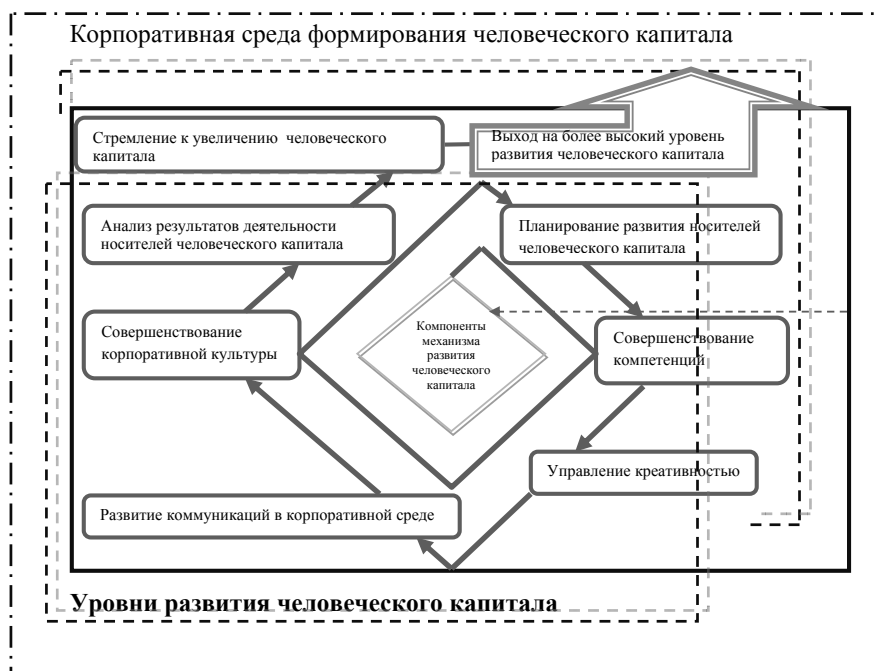
Рисунок 4 – Модельное представление механизма развития человеческого капитала в корпоративной среде

В рассмотренном временном интервале четко просматривается цикличность с минимальными значениями в 2009 году, обусловленными кризисными явлениями 2008 года. Исключением является субиндекс корпоративного уровня. Это доказывает гипотезу о том, что национальный, региональный, отраслевой и базовый уровни формирования условий развития человеческого капитала более чувствительны к изменениям внешней среды и экономической политики государства, а корпоративный уровень корректирует внешние проявления за счет внутренних резервов. Условия развития человеческого капитала на корпоративном уровне развиваются по самостоятельному сценарию, отличному от других рассмотренных уровней, и зависят от особенностей корпоративной среды. Автором предложено модельное представление механизма развития человеческого капитала в корпоративной среде (рис. 4).