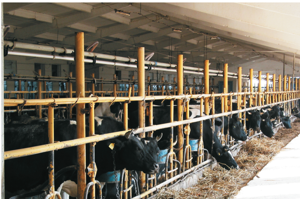
В молочном комплексе племсовхоза «Россия»