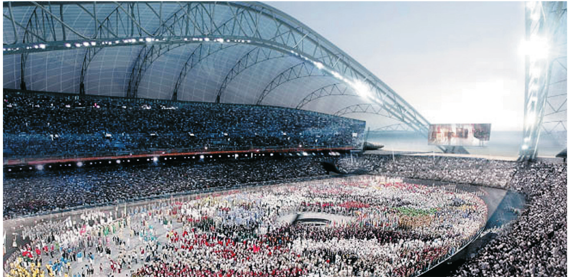
Центральный Олимпийский стадион Сочи-2014. Так будет!

То, что террористы тоже готовятся к Олимпиаде в Сочи и встретят её во всеоружии, сомнений не вызывает. Ряд бандглаварей открыто угрожают терактами в преддверии сочинской Олимпиады-2014. Об этом заявил и директор ФСБ РФ Александр Бортников на открытии X Совещания руководителей спецслужб, органов безопасности и правоохранительных органов иностранных государств – партнёров ФСБ России. «Угроза