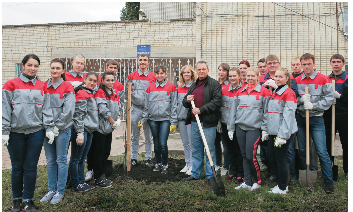
Трудовой десант СтГАУ на улице Серова в районе ветеринарных клиник