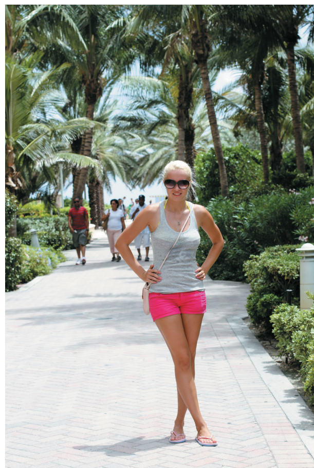
В солнечном Майами, юго-восток Флориды

О Times Square хочу сказать особо. Площадь в центре Манхэттена расположена на пересечении Бродвея и