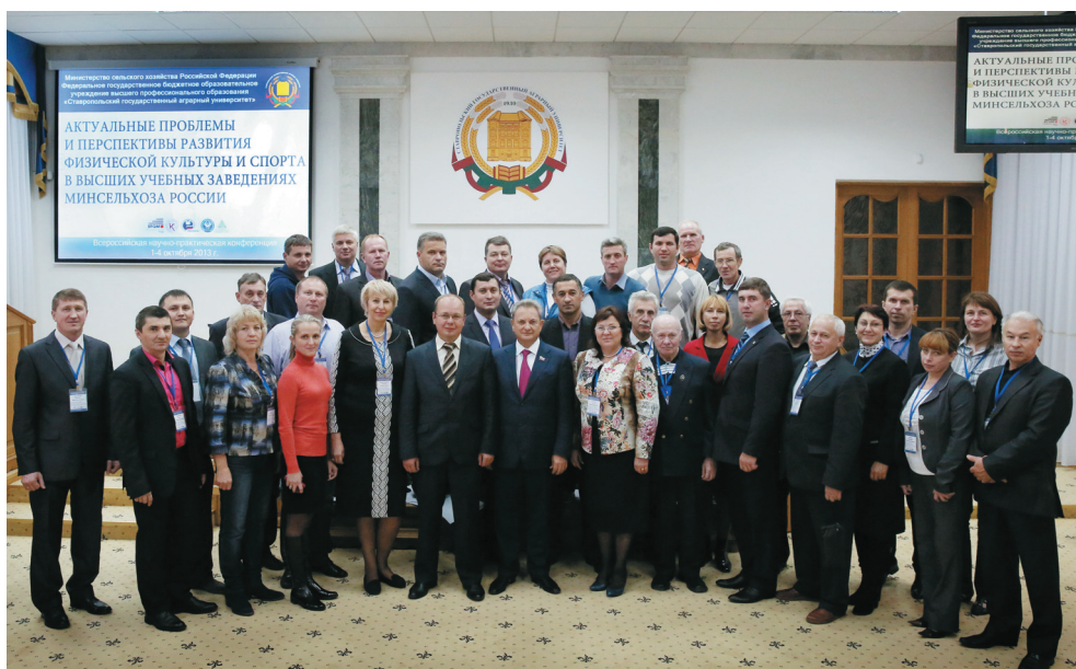
Всероссийская научно-практическая конференция «АКТУАЛЬНЫЕ ПРОБЛЕМЫ И ПЕРСПЕКТИВЫ РАЗВИТИЯ ФИЗИЧЕСКОЙ КУЛЬТУРЫ В ВЫСШИХ УЧЕБНЫХ ЗАВЕДЕНИЯХ МИНСЕЛЬХОЗА РОССИИ»

дений АПК и рыболовства. В спортивно-оздоровительном комплексе Ставропольского ГАУ состоялись товарищеские встречи по волейболу и мини-футболу. В завершение конференции её участники выразили общее мнение, что подобные встречи мобилизуют научную мысль на поиск оригинальных творческих решений актуальных проблем развития физкультуры и спорта, позволяют обменяться своими достижениями, привлечь внимание к авторским идеям и технологиям.