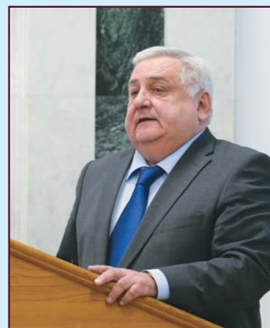
Ректор Российской академии кадрового обеспечения АПК И. И. БАХМЕТЬЕВ

Кстати, 15 % из числа опрошенных руководителей 50 сельскохозяйственных высших учебных заведений России заявили о слабой подготовке выпускаемых кадров в силу вышеуказанных причин. И это грустное, согласитесь, признание.