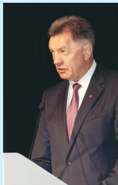
Выступление премьер-министра Литвы Альгирдаса Буткявичюса .