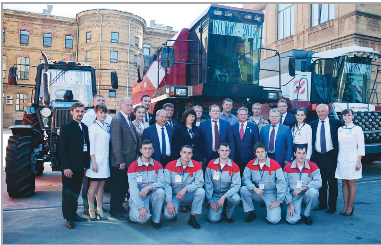
Студенческий актив Ставропольского агроуниверситета с представителями Министерства сельского хозяйства Российской Федерации и Правительства Ставропольского края. 18 сентября 2015 года.

Поскольку руководитель СтГАУ возглавляет Совет ректоров вузов Ставропольского