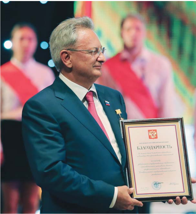
Благодарность от Президента России Владимира Путина за большой вклад в развитие образования, подготовку квалифицированных специалистов – высокая оценка деятельности коллектива ордена Трудового Красного Знамени Ставропольского государственного аграрного университета.

Ставропольского края по образованию и науке, призналась: «Мы на самом деле гордимся, что на нашей земле есть такой вуз».