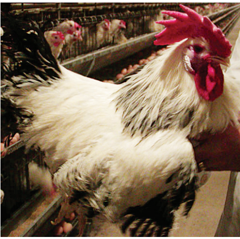
Окончание. Начало на стр. 7

Эффективна господдержка птицеводства в виде субсидированных долгосрочных кредитов на реконструкцию и модернизацию яичных и мясных птицефабрик, краткосрочных кредитов – на покупку кормов, ветпрепаратов и молодняка, обеспечивающих в совокупности рентабельность производства птицепроизводства не менее 10 %.