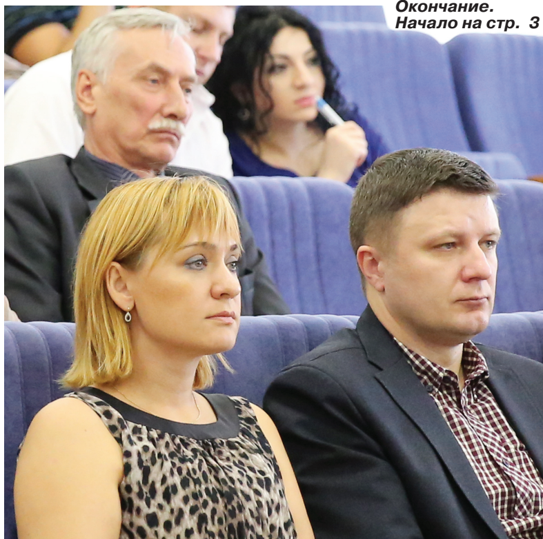
Окончание. Начало на стр. 3