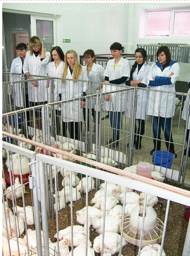
Студенты факультета технологического менеджмента Ставропольского ГАУ оценивают состояние цыплят-бройлеров в университетском виварии.