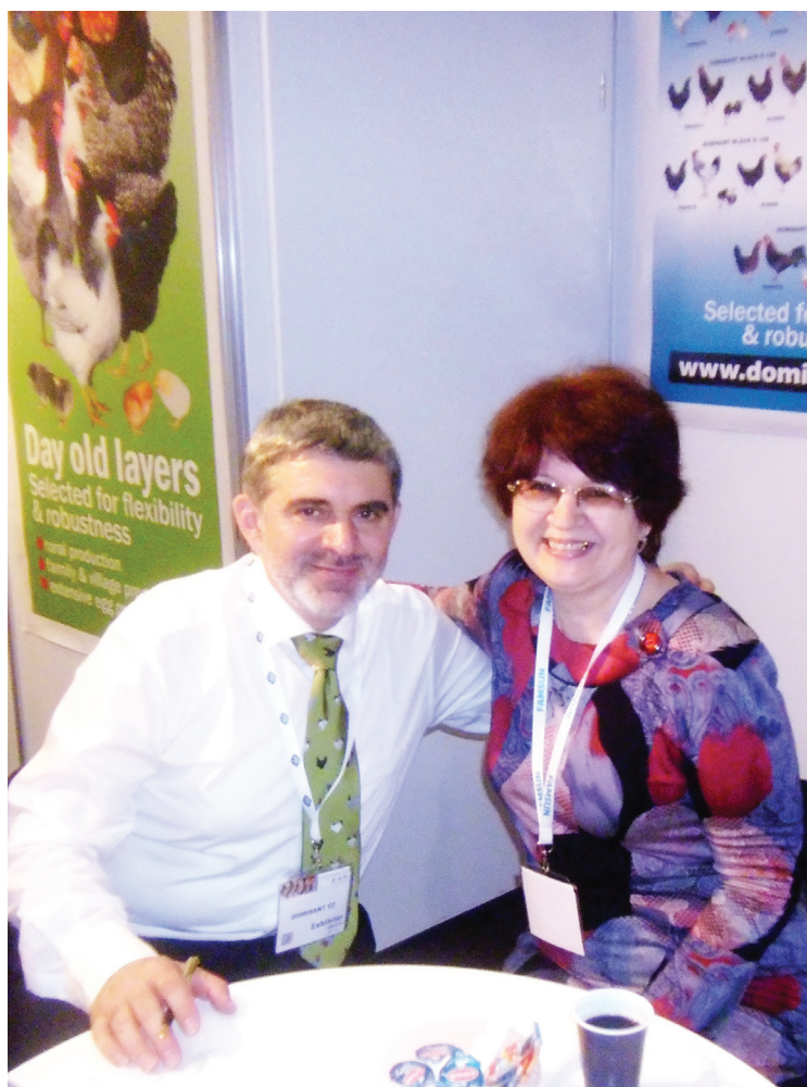
Коллегам-птицеводам, выпускникам Тимирязевки, есть что обсудить.

– Насколько были интересны дискуссионные площадки выставки?