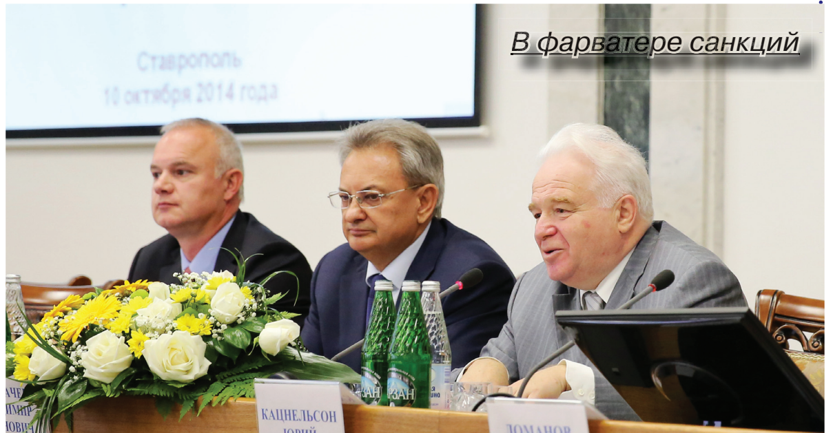
В фарватере санкций

Неоднозначная дискуссия по острой проблеме развернулась на площадке Аграрного университета.